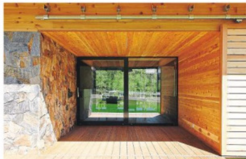
Příčné prosvětlení domu inspirované průjezdnými stodolami. Prudký spád terénu umožnil úrovňové spojení sklepa. Hlavní obytná místnost s převýšenou jídelnou

Autoři: Ián Stempel, Jan Tesal www.stempel.cz Dodavatel: Stavební firma Hájek, s. r. o. Plocha pozemku: 2715 m 2 Zastavěná plocha: 129 m 2 Obstavený prostor: 1200 m 2 Realizace: 07/2010–11/2011