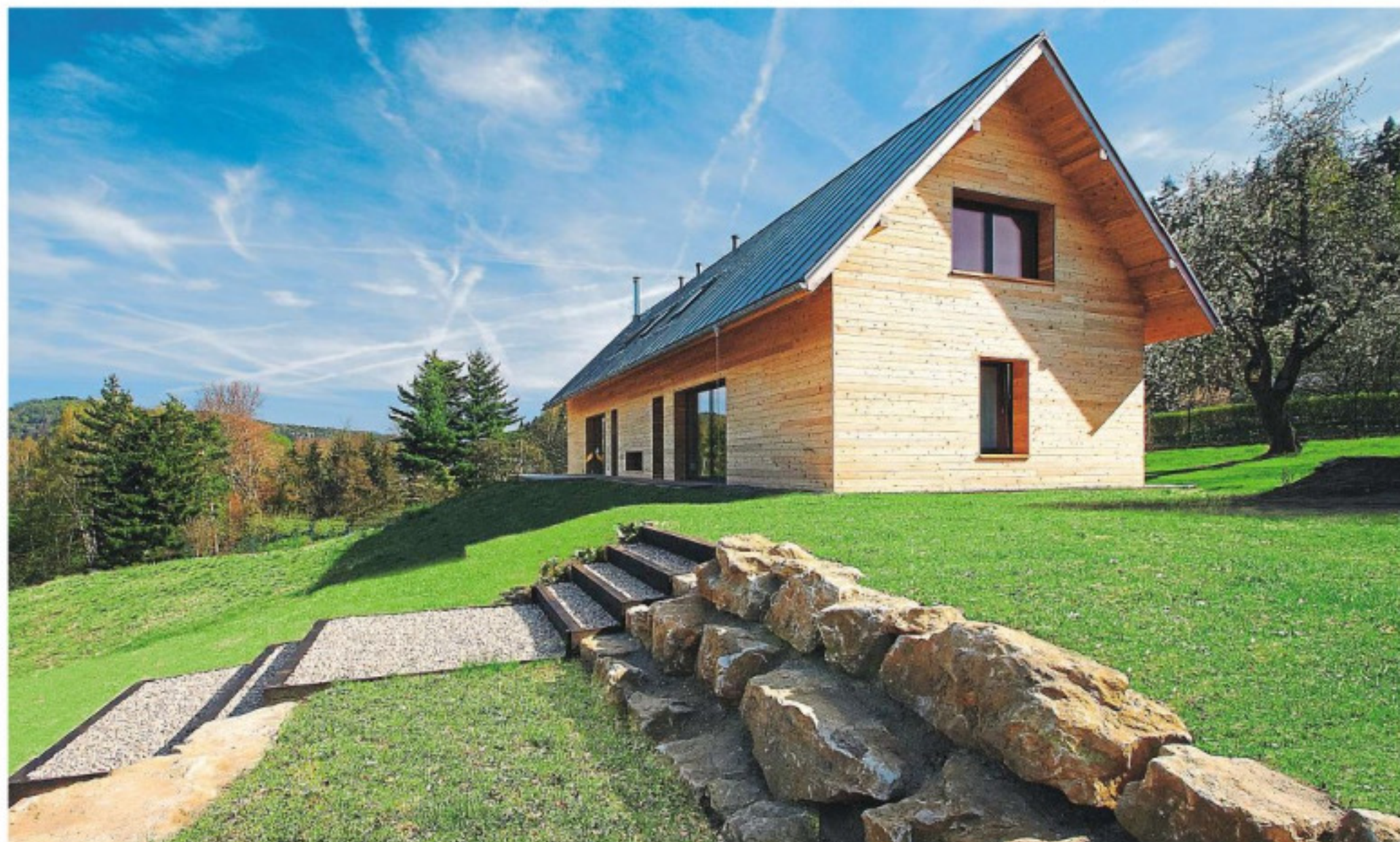
Úzká a dlouhá hmota domu se strmým sklonem sedlové střechy je logicky umístěna do vrstevnice Měsajského terénu

V Českém ráji vznikl dům, který je moderní, a přitom přirozeně zapadá do krajiny